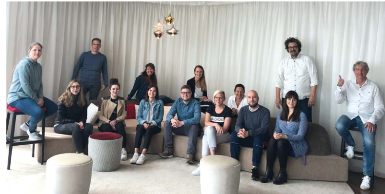
Teilnehmer:innen der ersten Modulreihe

Darüber hinaus bieten wir die Möglichkeit, Teil eines großen Netzwerks von Stabsmitarbeiter:innen zu werden und von weiteren Angeboten zu profitieren.